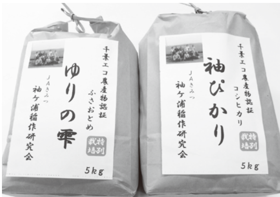
コシヒカリのエコ米を「袖ぴかり」、ふさおとめのエコ米を「ゆりの雫」として、ゆりの里で販売しています。