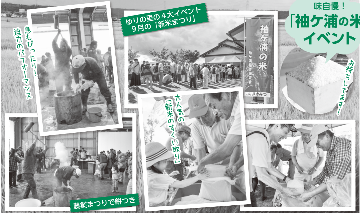
息もぴったり! 迫力のパフォーマンス